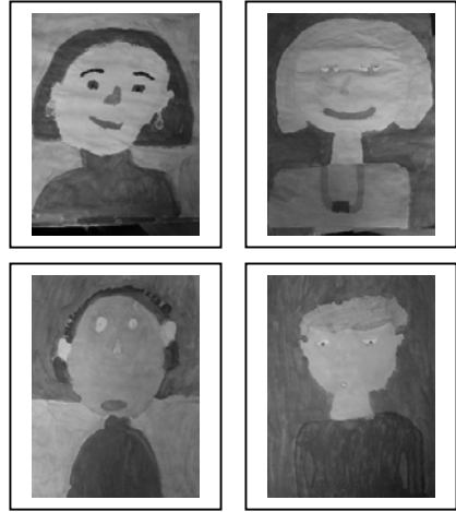
Das Lehrerkollegium unserer Schule – aus

Bei allen unterschiedlichen Erziehungsstilen und bevorzugten Unterrichtsformen steht in unserem Kollegium deshalb das Gespräch, das Voneinanderlernen, das Füreinander und Miteinander im Vordergrund.